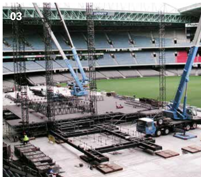
01 Układanie Arena Panels, Amsterdam Arena | 02 Droga transportowa | 03 Podstawa pod scenę i powierzchnia do prac montażowych | 04 System ochrony podłoża eps U2 360° Tour, Barcelona