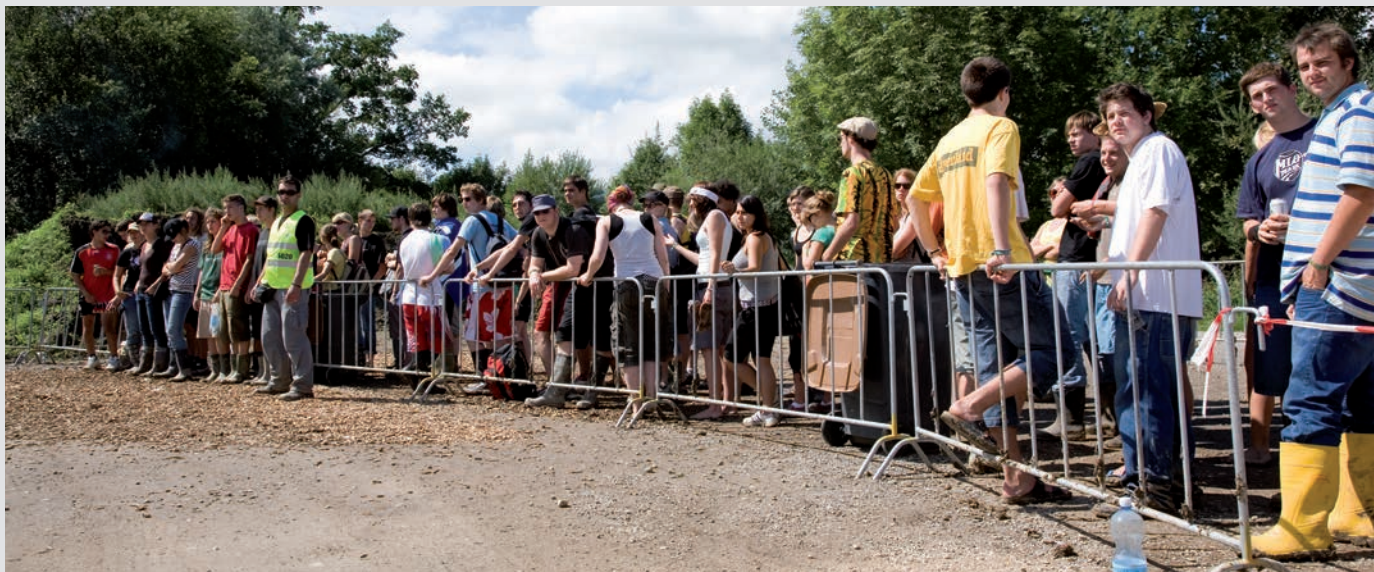
Przepisowo i bezpiecznie – odgraniczenie przystanku autobusowego na festiwalu