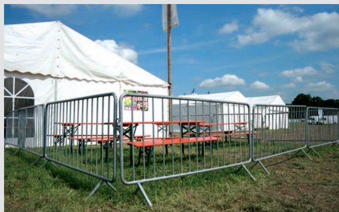
Strefa VIP i cateringu – skuteczne i efektywne ogrodzenie