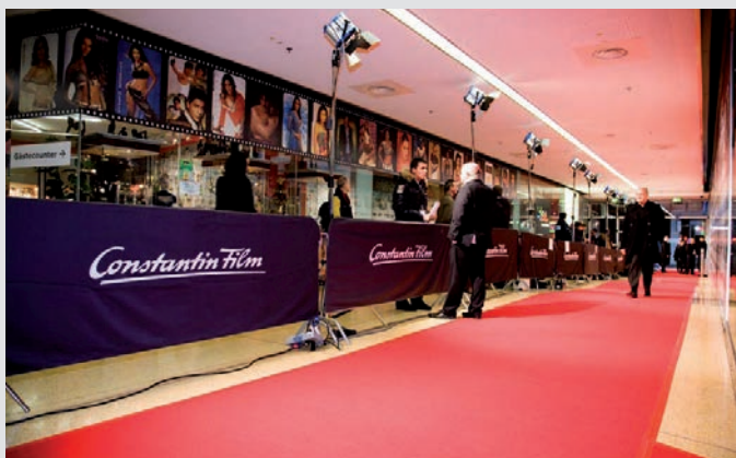
Bariery lekkie z bannerami reklamowymi – premiera filmu, Monachium