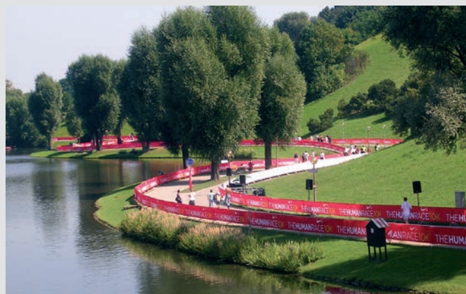
Ogrodzenie terenu biegów długodystansowych z bannerami reklamowymi