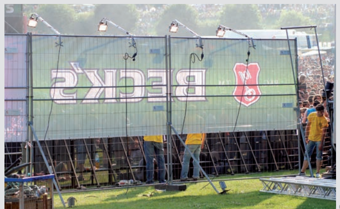
Optimaler Sichtschutz, hier mit zusätzlicher Beleuchtung