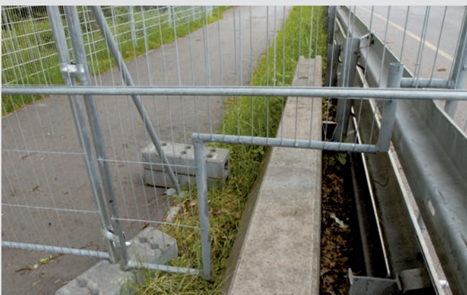
Sonderanfertigungen zur FIFA WM 2006