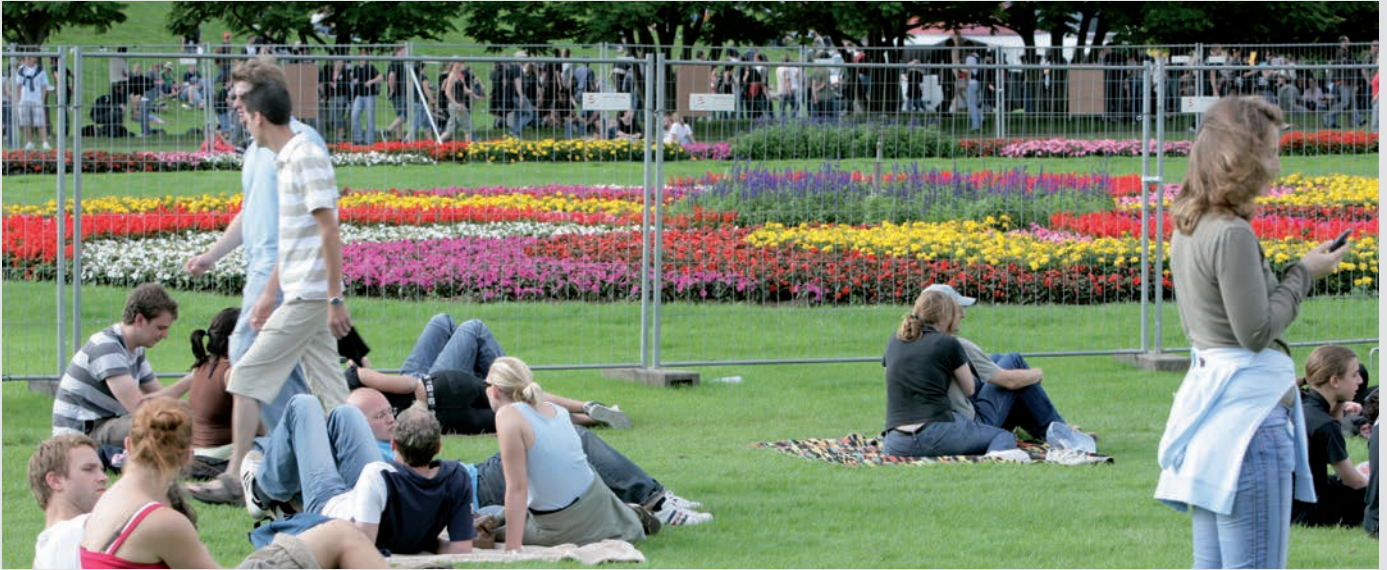
Abgrenzung von empfindlichen Gartenanlagen, Rheinkultur Festival