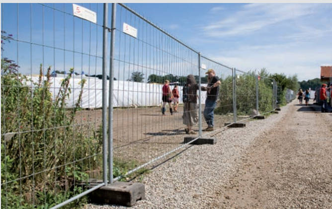
Geländeumzäunung, Chiemsee Reggae Summer Festival