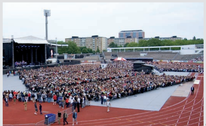
Elton John Open Air Konzert, Malmö Stadion