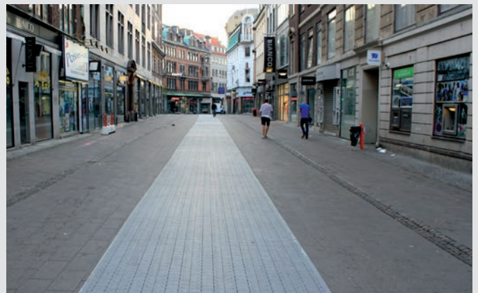
Copenhagen Fashion Week, 1,6 km Catwalk durch die Innenstadt