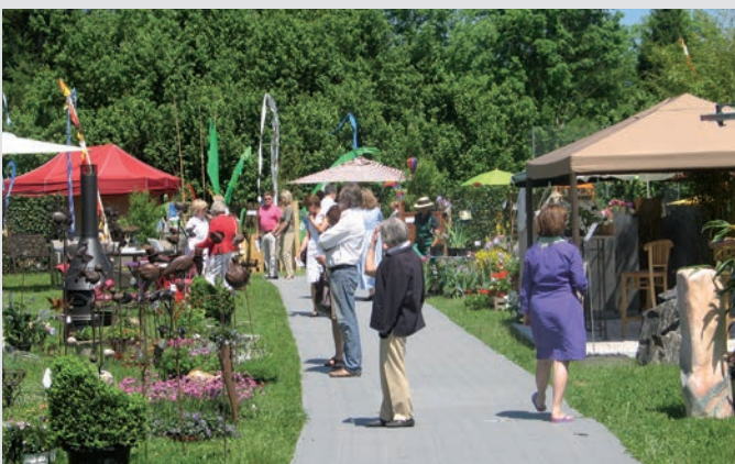
Portafloor als Fußgängerweg, Messe Home & Garden