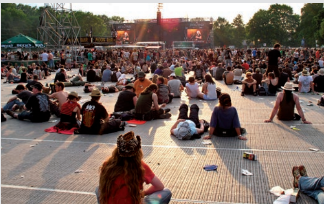
Abendstimmung bei Rock im Park, Nürnberg