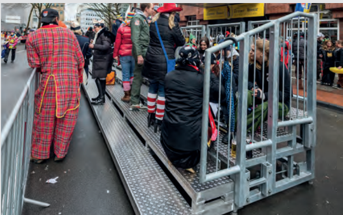
In nur fünf Schritten zur Tribüne: Abladen, Positionieren, Verbinden, Aufklappen und Geländermontage