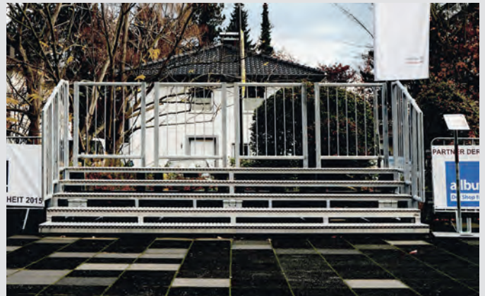
Die schmale Bautiefe der Klapptribüne ermöglicht den Aufbau auch bei räumlich begrenzten Verhältnissen