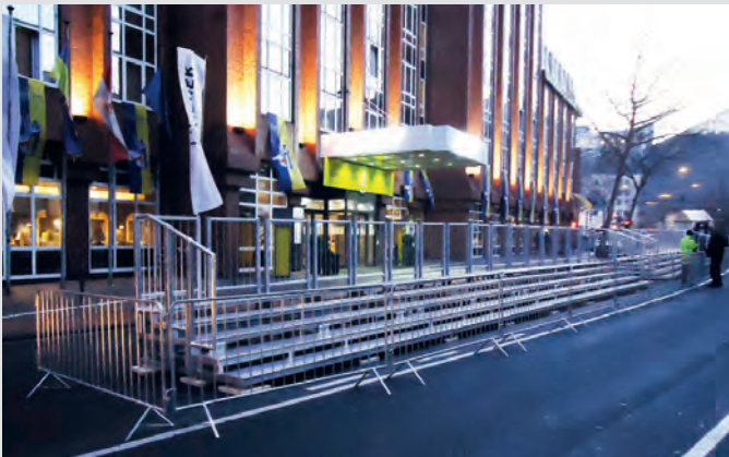
Das innovative Klapptribünensystem stellt die ideale Lösung für innerstädtische Veranstaltungen dar