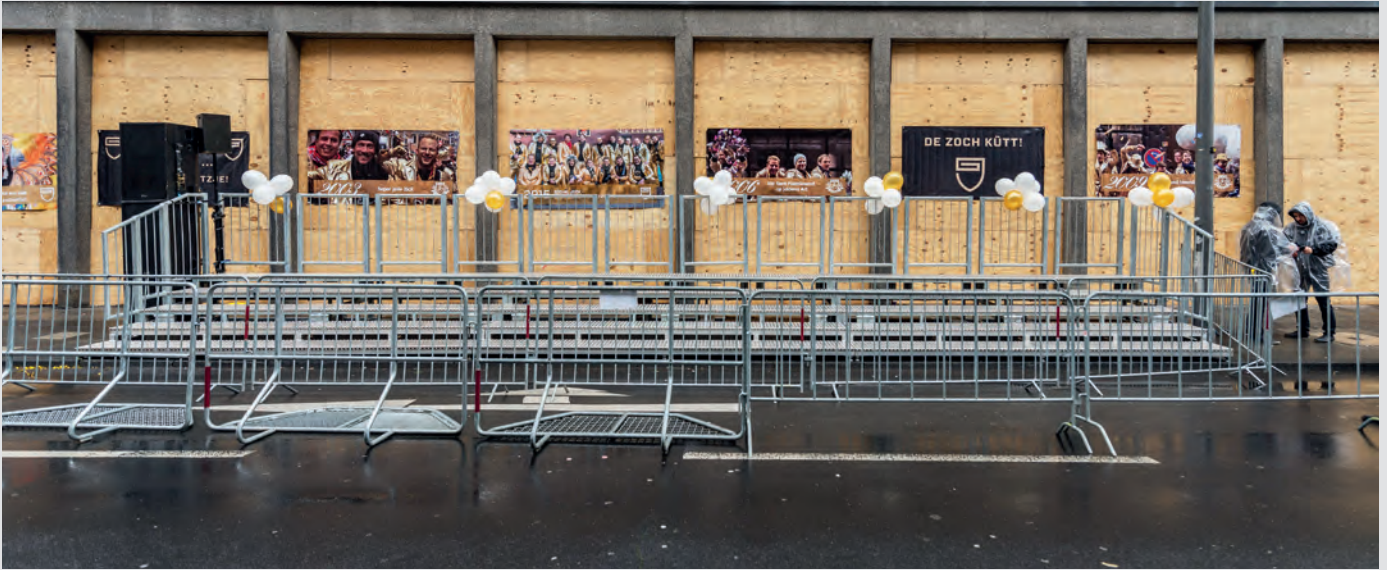
Die mobile Stehtribüne 5 S ist speziell für den Einsatz in Städten konzipiert und so ideal nutzbar bei Radrennen, Marathonläufen oder Festzügen