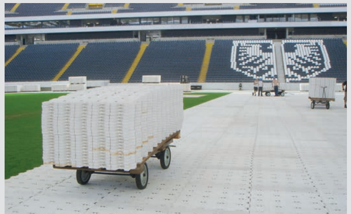
Aufbau der Stadionabdeckung mit Supa-Trac