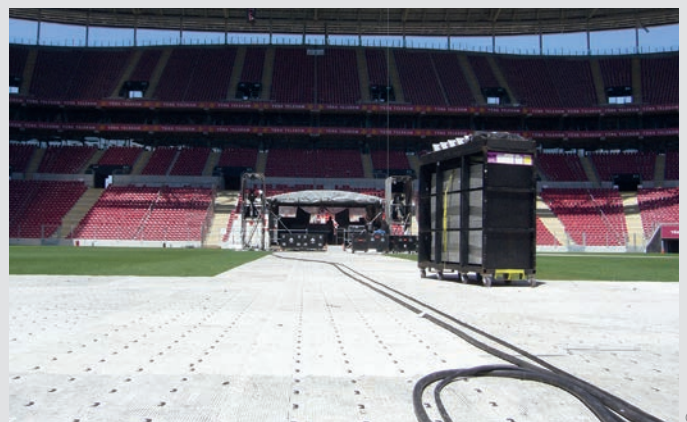
Ebene Oberfläche für Cases & Co.