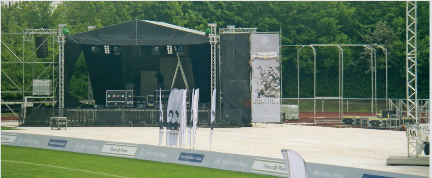
Supa-Trac bei einer Industrieveranstaltung, Ellwangen