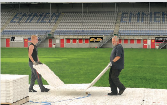
Leicht und schnell von Hand verlegbar