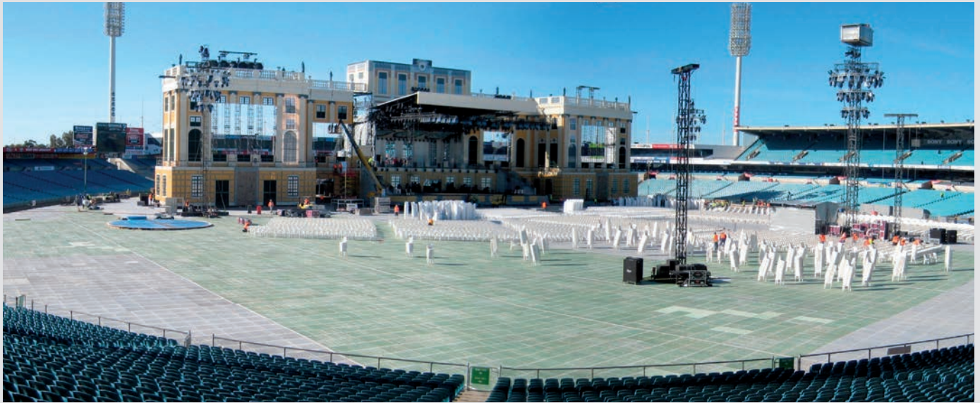
Stadionrasenabdeckung, André Rieu World Stadium Tour, AAMI Stadium Adelaide