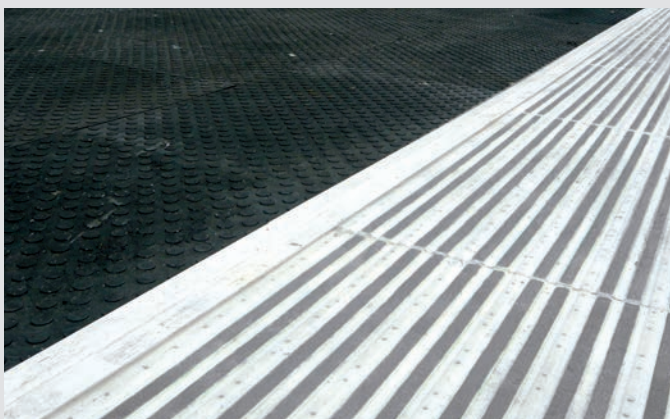
Nahtloser Übergang ohne Stolperkanten – Terraplas kombiniert mit anderen eps Bodenschutzsystemen