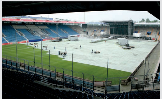
Abdeckung Stadionrasen, Herbert Grönemeyer Konzert, Ruhrstadion Bochum