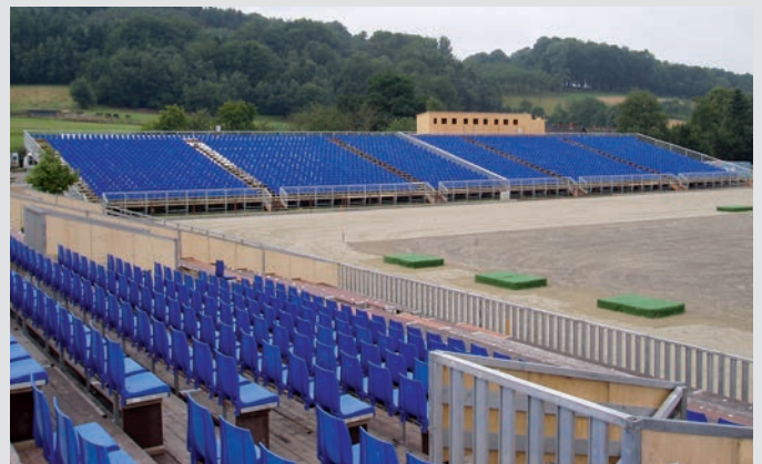
eps Tribünen bei der EM der Dressurreiter, Hagen