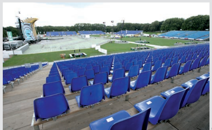
Open Air Arena mit eps Tribünen, Robbie Williams Close Encounters Tour, Köln