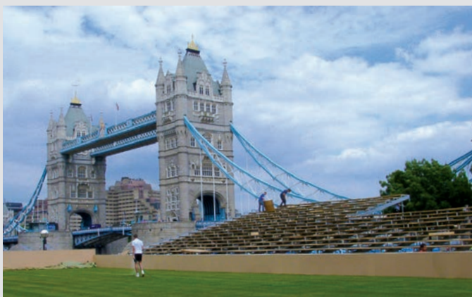
Aufbau eps Tribünen bei der Veranstaltung Wimbledon at Tower Bridge, London