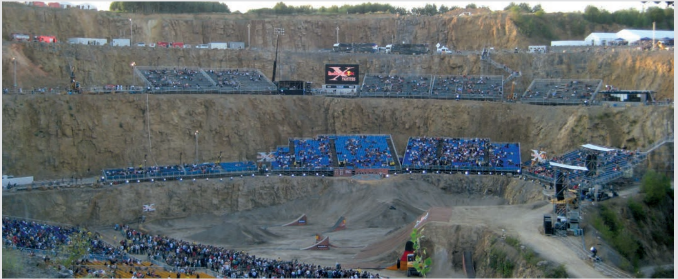
Tribünenlandschaft bei einer Motorcross Sportveranstaltung in einem Steinbruch